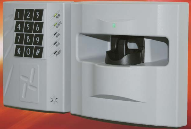
SS2265 FV III K