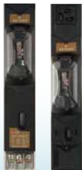
15A ブレーカ×2を 搭載した30Aタイプ