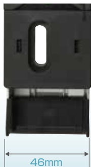
スリムタイプなボディ!