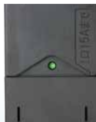
通電表示LEDを標準装備 (30Aタイプは1エリアに1個)