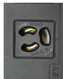
抜止式プラグ差込口